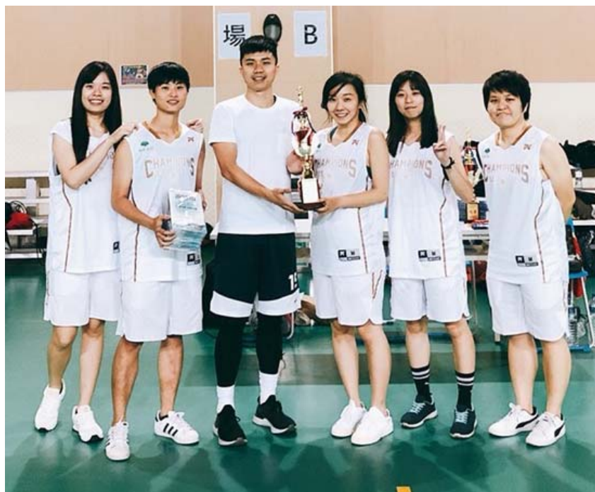
女子籃球冠軍頒獎合影