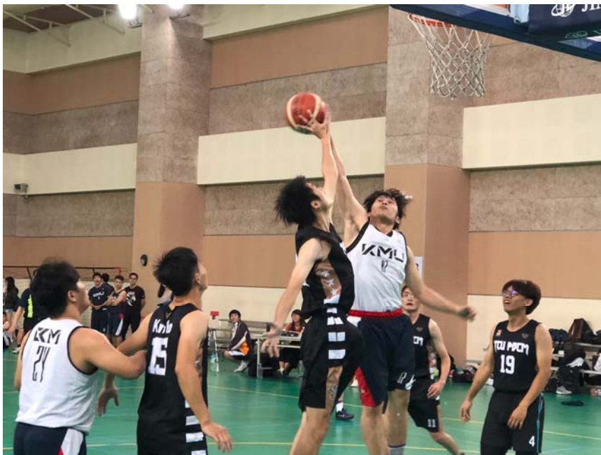
男子籃球賽中攝影